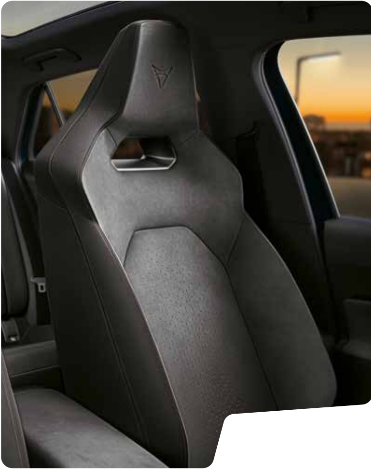
← DINAMICA® GRANITE GREY BUCKET SEATS De