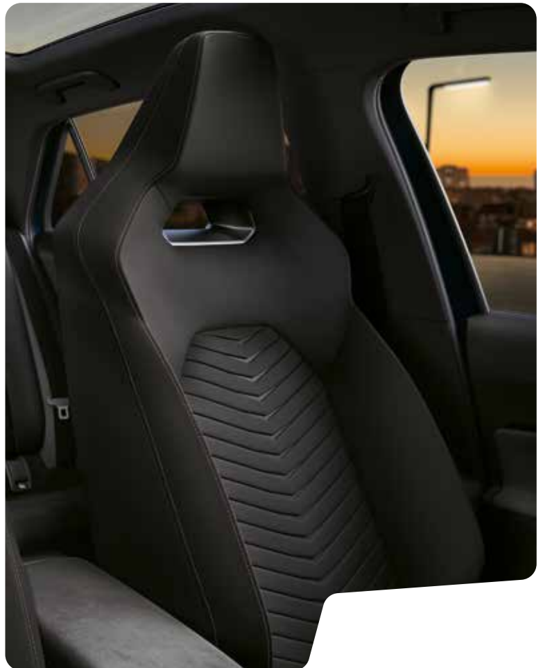
→ SEAQUAL® BUCKET SEATS B