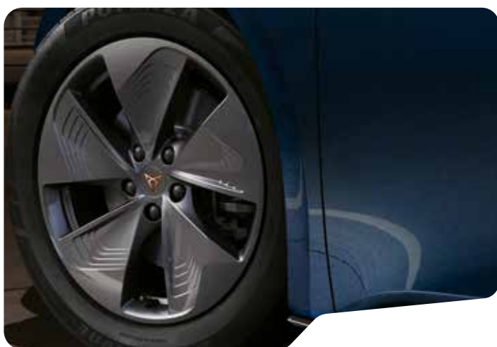
↑ 18" CYCLONE B