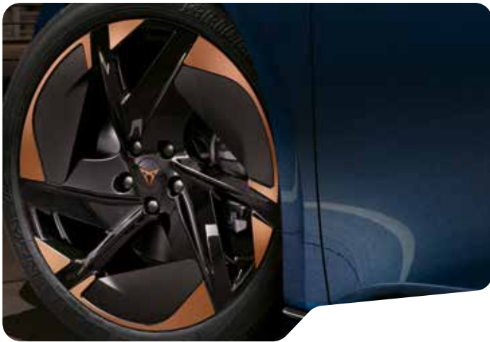
→ 20" BLIZZARD B | e