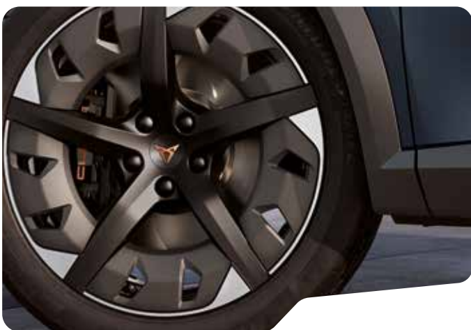
↑ 19" EXCLUSIVE 38/4 AERO SPORT BLACK AND SILVER F VZ