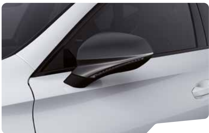
↓ NEVADA WHITE 2 F VZ