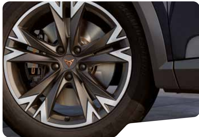
↑ 18" PERFORMANCE 38/2 SPORT BLACK AND SILVER F