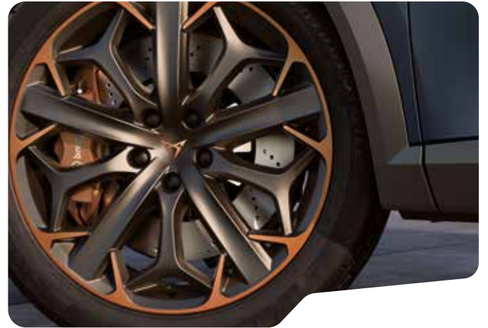
↓ 19" EXCLUSIVE 38/5 SPORT BLACK AND COPPER VZ