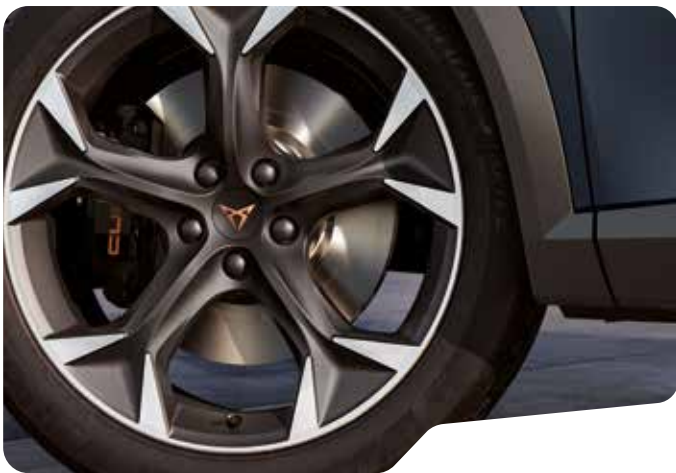
↑ 19" EXCLUSIVE 38/3 SPORT BLACK AND SILVER F VZ