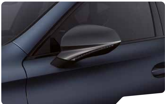
↓ PETROL BLUE MATTE 4 F VZ VZ5