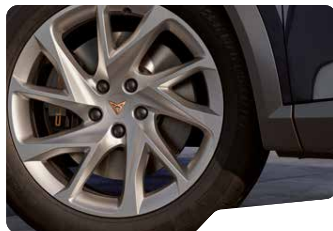
↑ 18" PERFORMANCE SILVER F

Formentor F Formentor VZ VZ Formentor VZ5 VZ5 Στάνταρ ■ Προαιρετικά ■