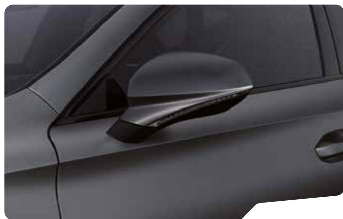
↓ MAGNETIC TECH MATTE 4 F VZ VZ5