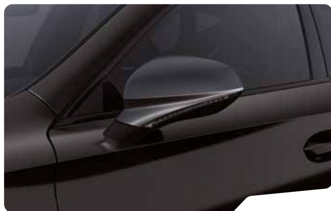
↓ MIDNIGHT BLACK 2 F VZ VZ5