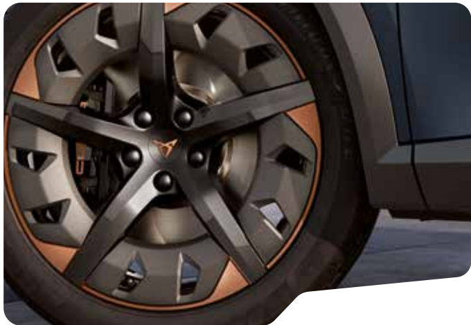
↓ 19" EXCLUSIVE 38/6 AERO SPORT BLACK AND COPPER? F VZ